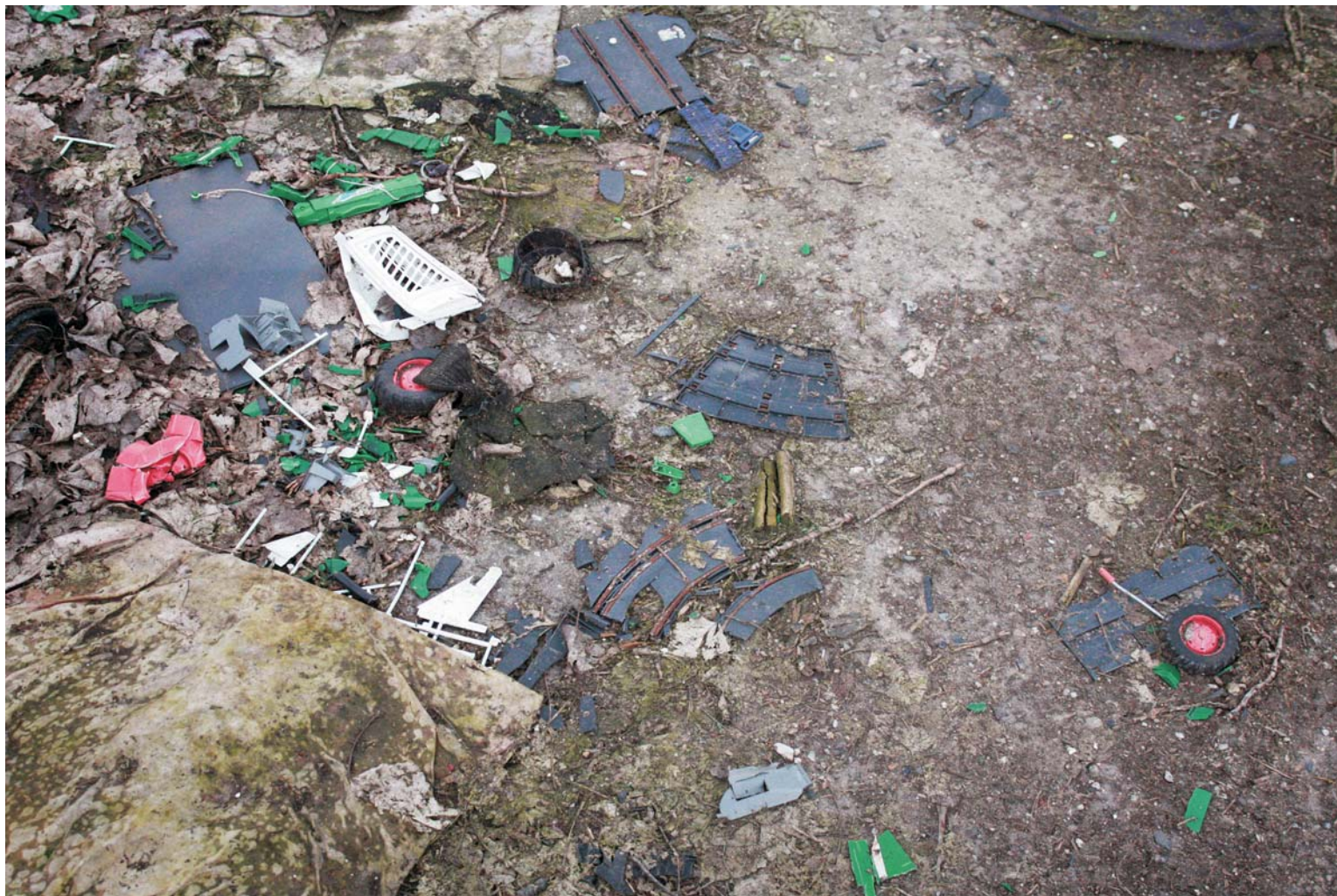
ART FROM PRAGUE - ze souboru Don't tell me what you see