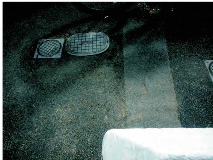
DITA JIŘIČKOVÁ - ze souboru Proměna