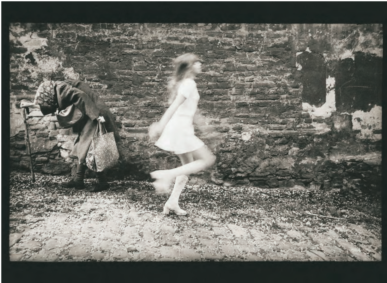
JAN SAUDEK - Mládí a stáří