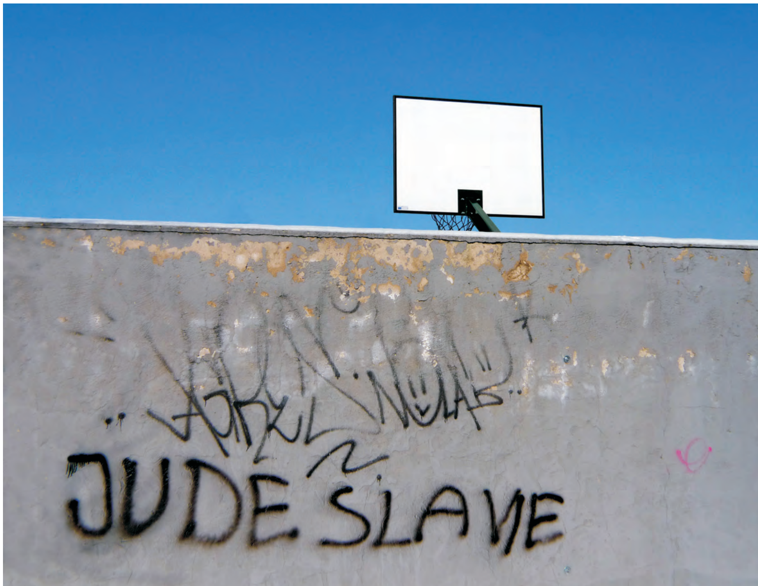
MARTIN SEKAL - ze souboru Dva světy