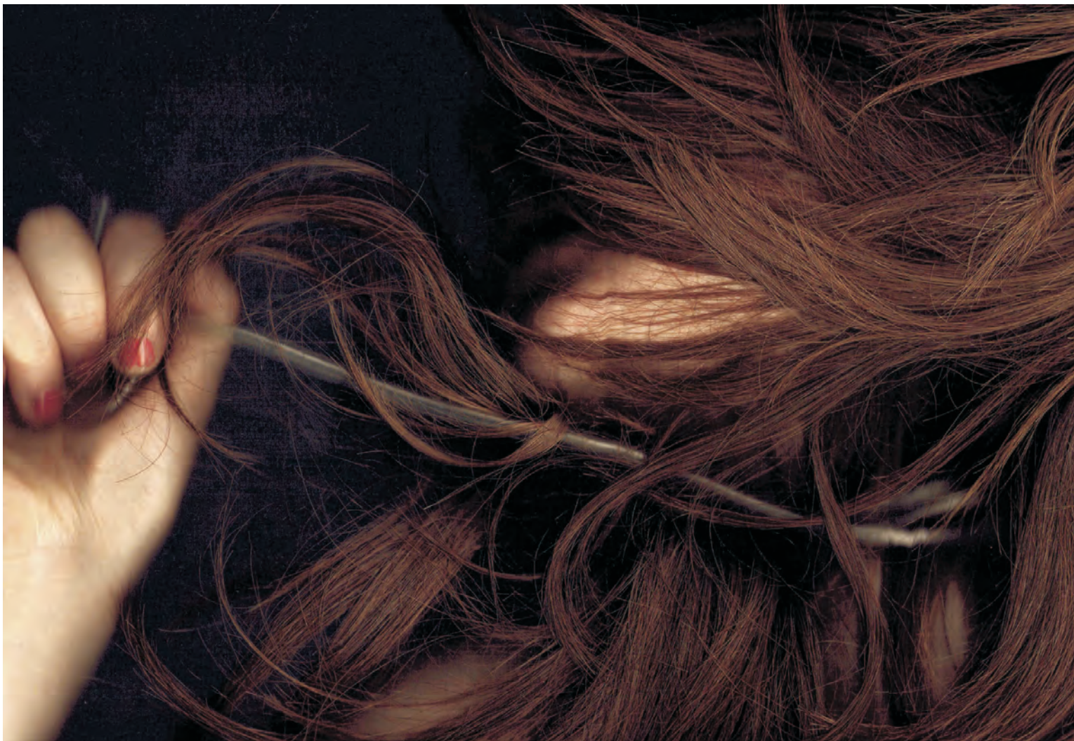
YVONA KOVÁŘOVÁ - ze souboru Sama sobě