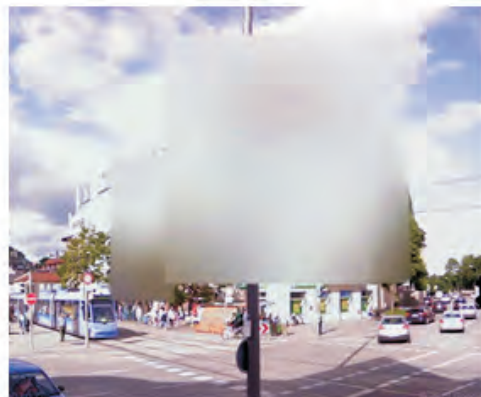
LENKA KOMÍNKOVÁ - ze souboru Skrytý Mnichov