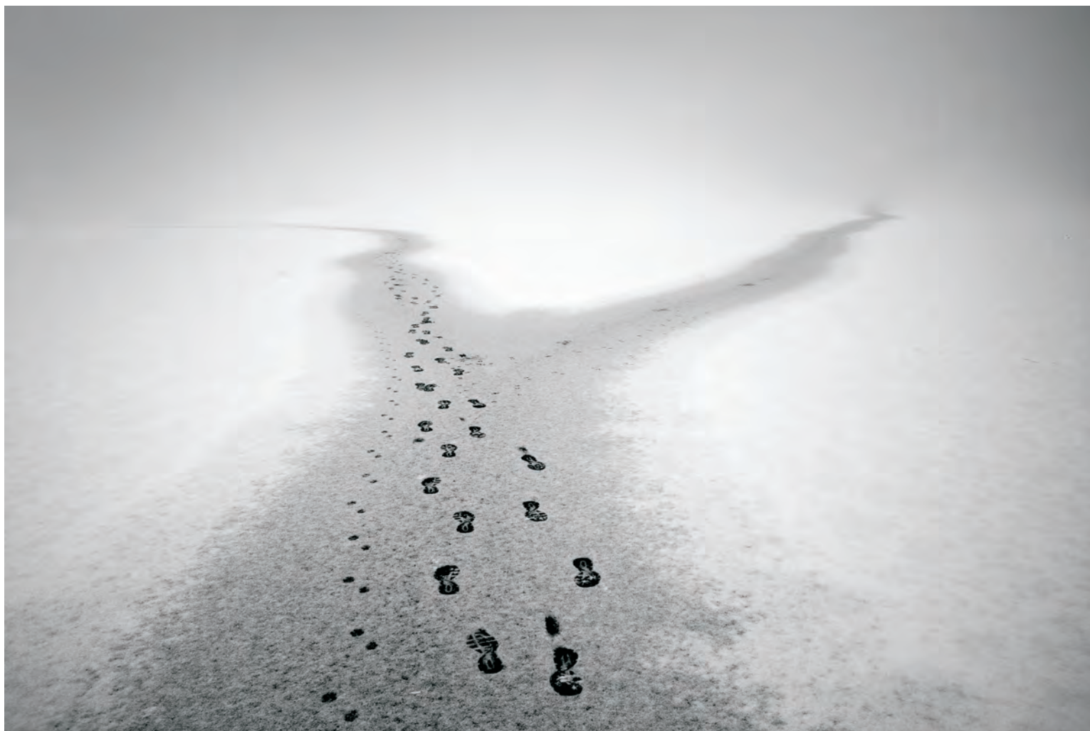
KAREL PRSKAVEC - ZE SOUBORU STOPY CIVILIZACE