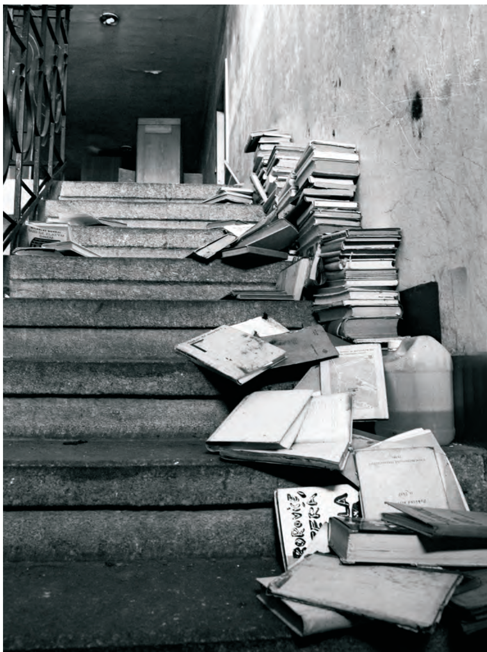
VLASTA NÝDLOVÁ - ZE SOUBORU GENIUS LOCI