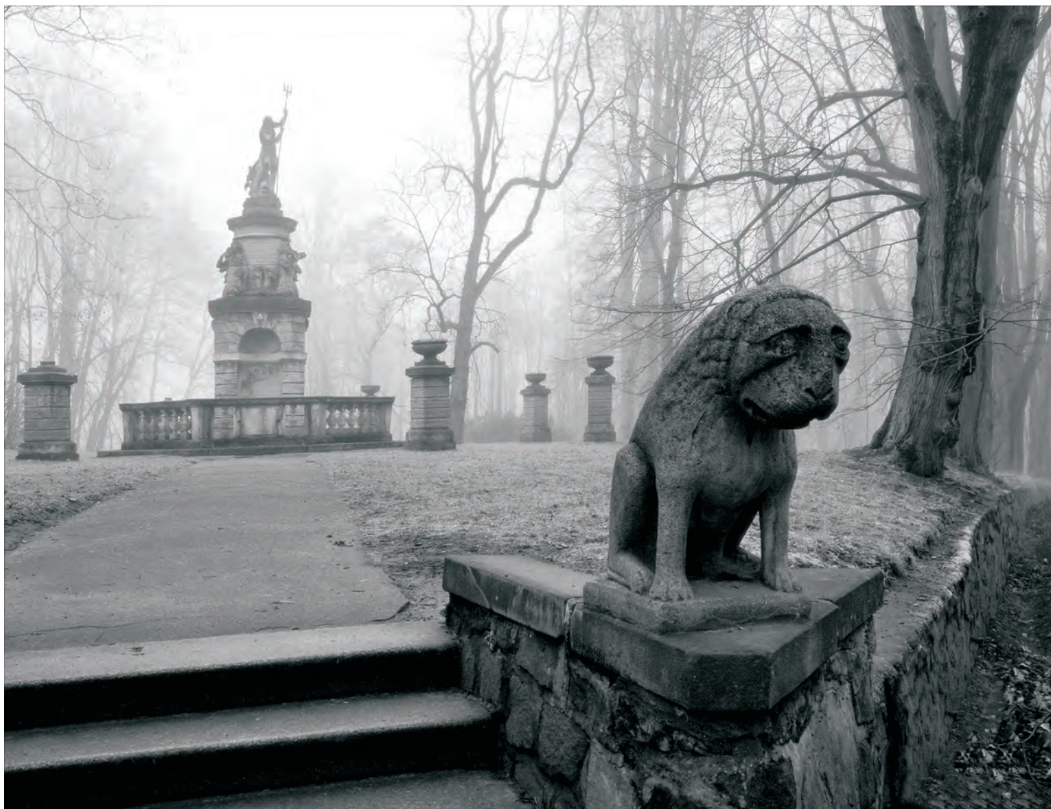
JOSEF PTÁČEK - ZE SOUBORU ZEMĚ KRÁSNA