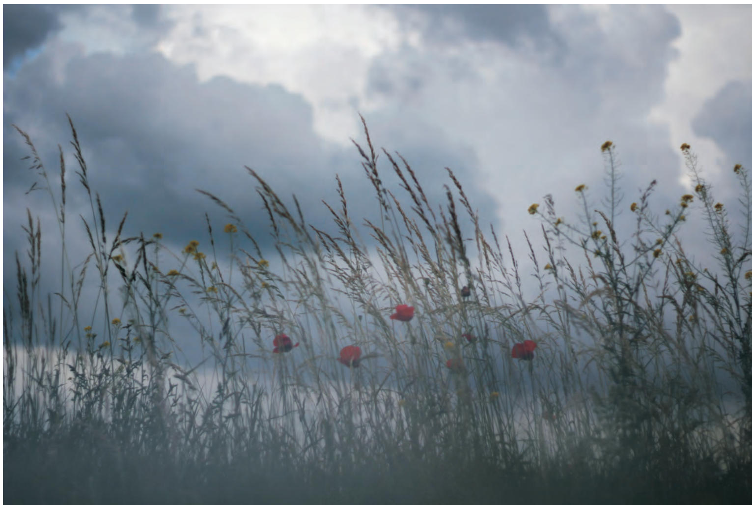
EVA FALTUSOVÁ - ZE SOUBORU MY DREAMLIKE DAY