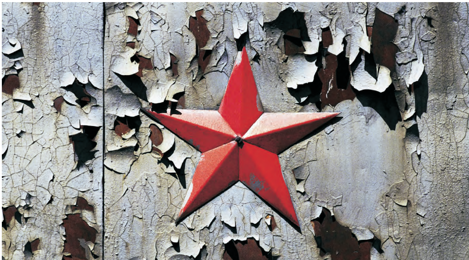
DANA KYNDROVÁ - ZE SOUBORU ODCHOD SOVĚTSKÝCH VOJSK