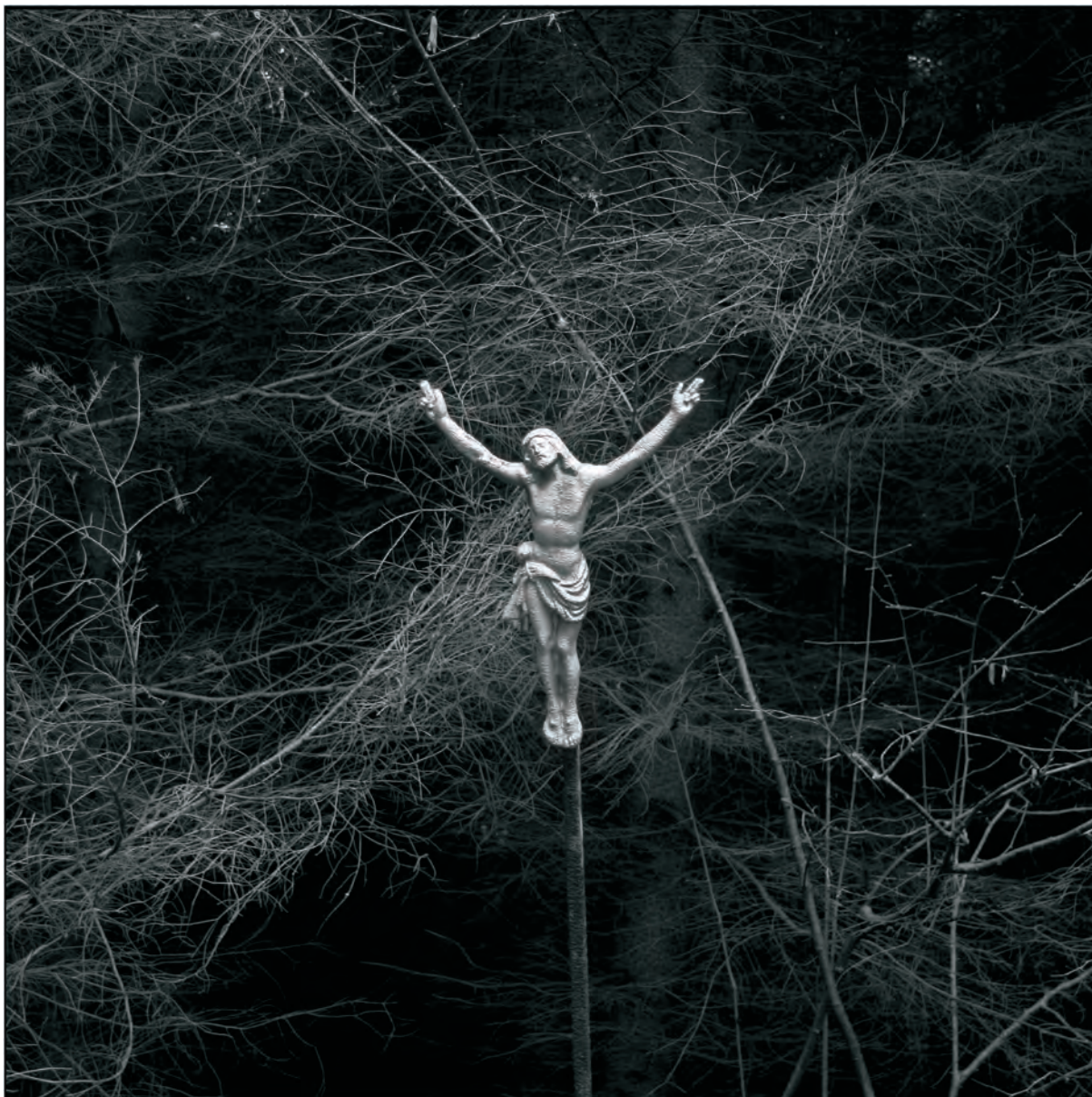
PROJEKT DOMOV , VÁCLAV NĚMEC - ZE SOUBORU SUDETY