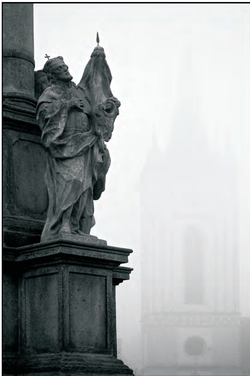
MICHAL DVOŘÁK - ZE SOUBORU BLATNÁ HLEDÁČKEM NÁPLAVY