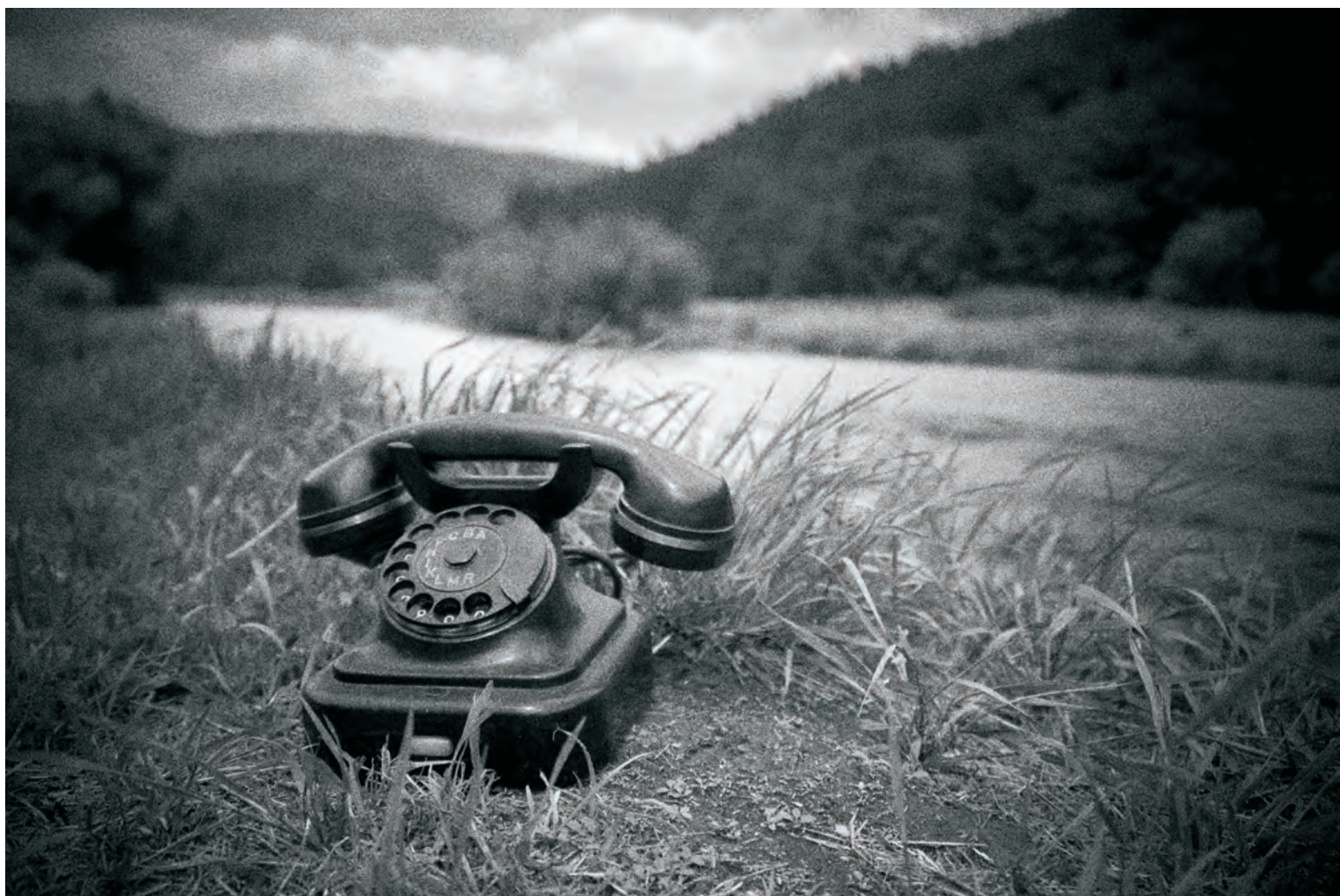
DAGMAR SKOŘEPOVÁ - ZE SOUBORU ZTRÁTY A NÁLEZY