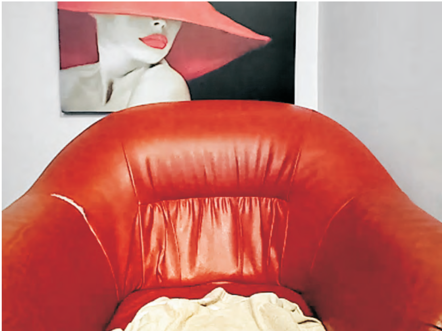
ZDENĚK VAJNER - ZE SOUBORU VOID