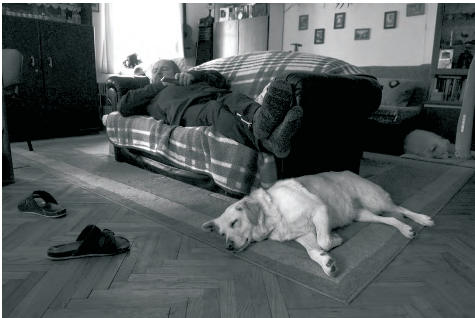
SKUPINA[28], MICHAELA HRUBÁ - ZE SOUBORU ŽIVOT NA HRANICI