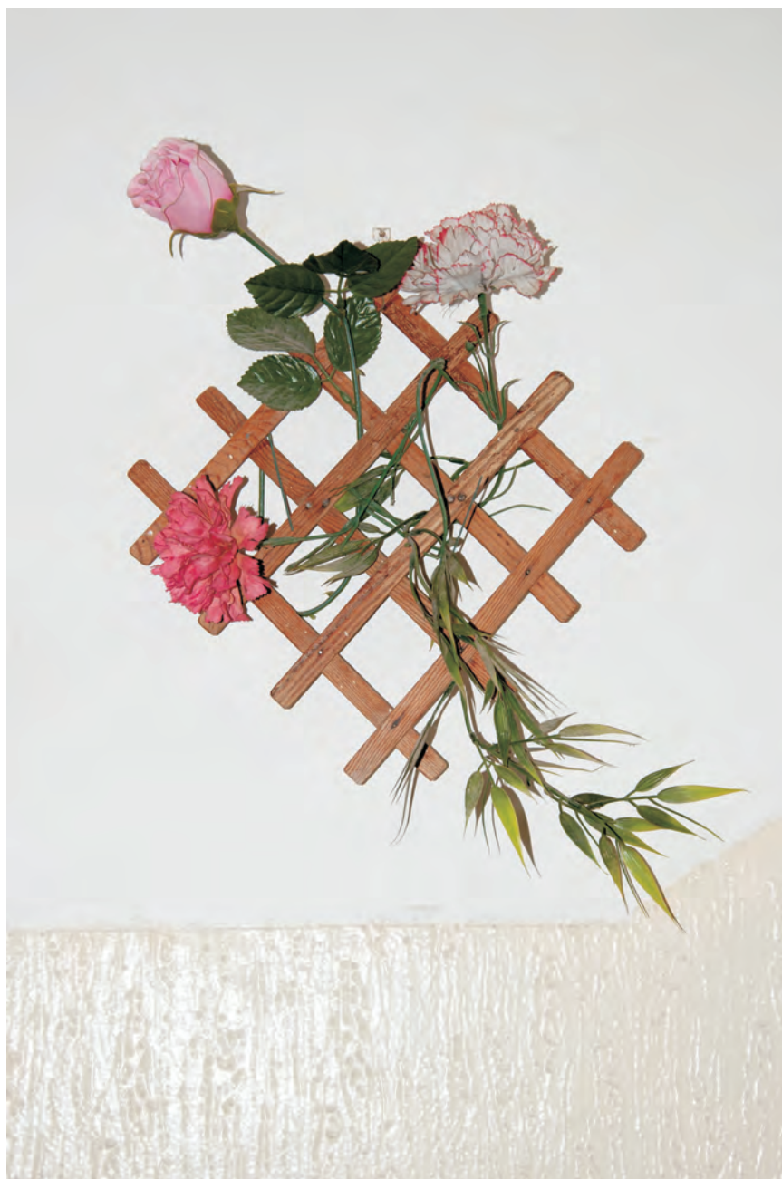
KATEŘINA VOJTOVÁ - ZE SOUBORU ODKAZ