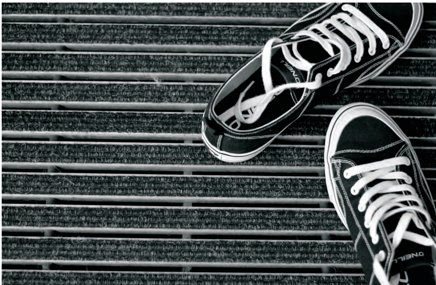
TOMÁŠ HURSKÝ - ZE SOUBORU KROK ZA KROKEM