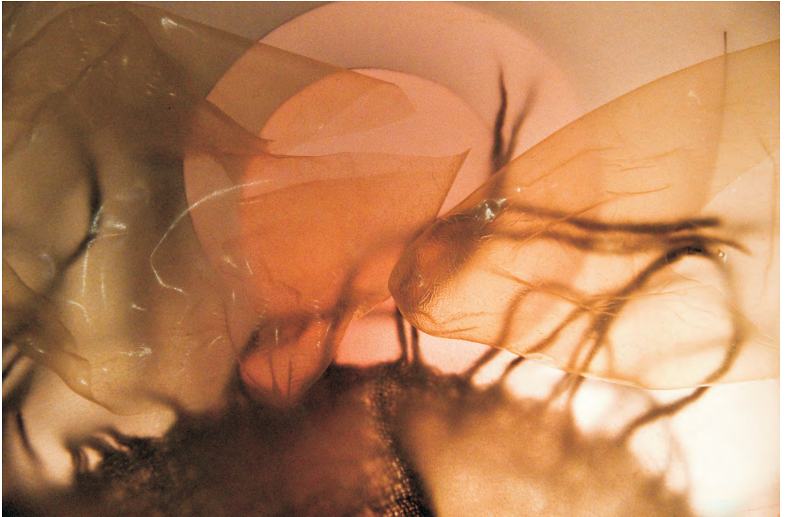
VĚRA MACHKOVÁ - ZE SOUBORU ZROZENÍ