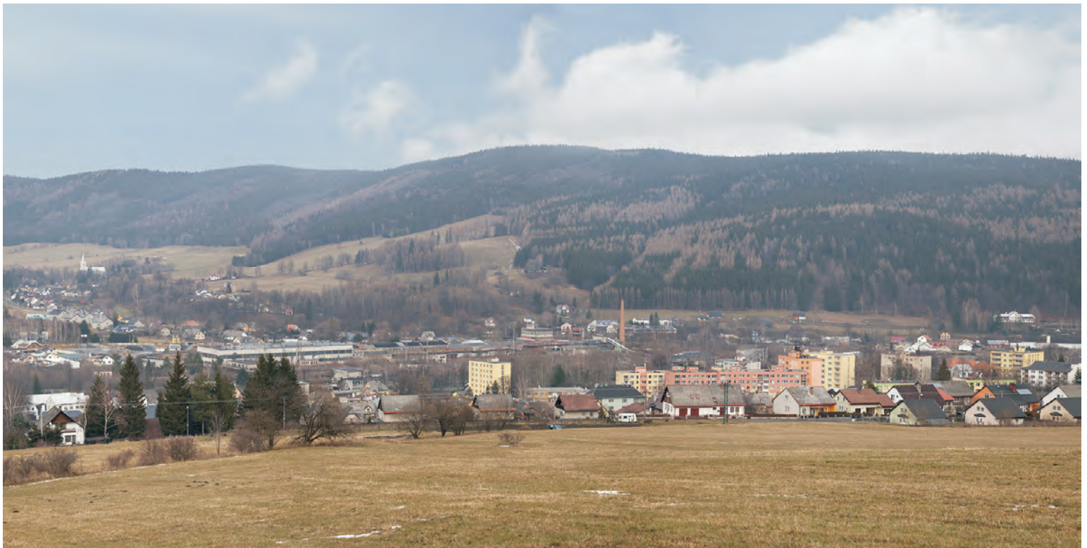
PAVEL MATELA - ZE SOUBORU DOMA JSI TAM, KDE SE OBĚŠÍŠ