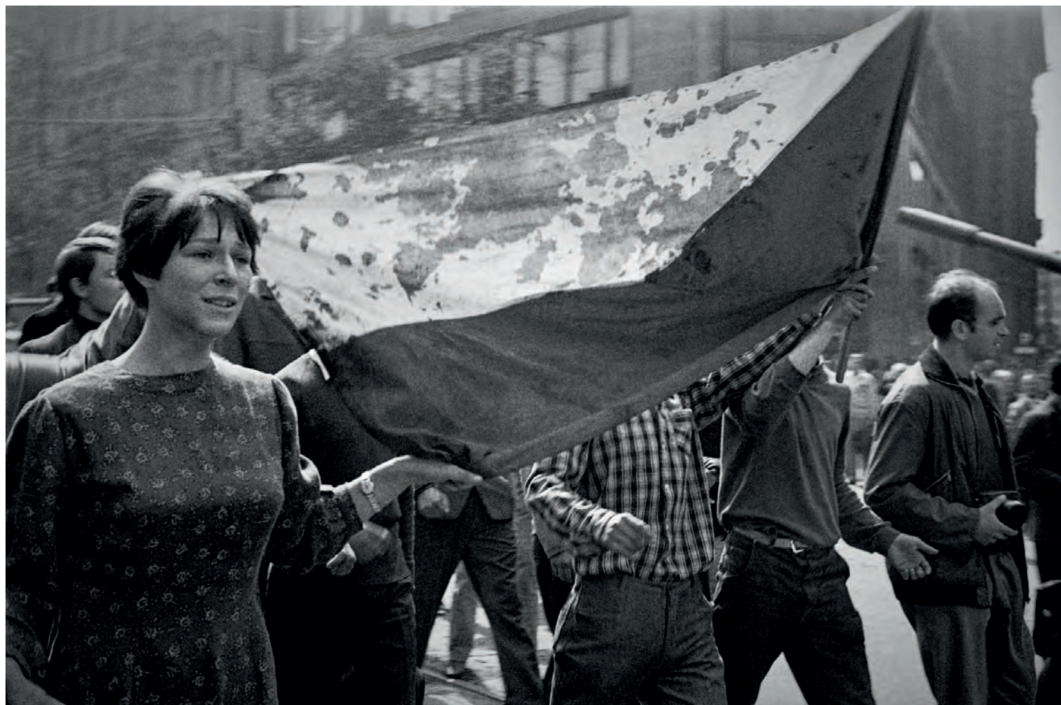
OLDŘICH ŠKÁCHA - ZE SOUBORU SRPEN 1968