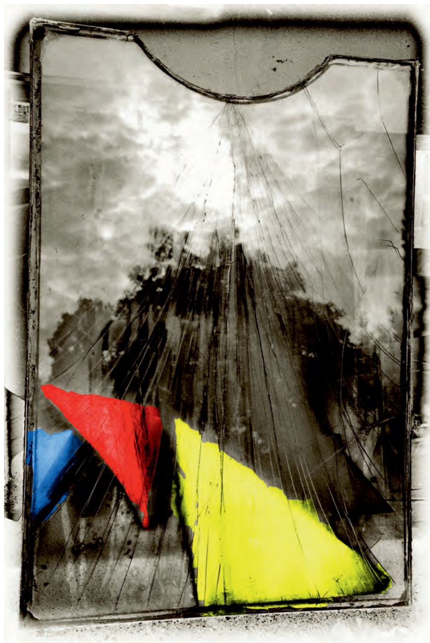
KAREL BLAHNA - ZE SOUBORU VZPOMÍNKY