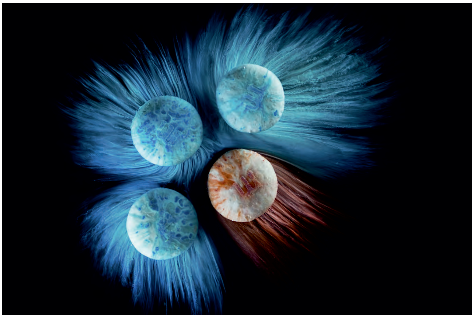
TOMÁŠ BONHARD - ZE SOBORU FLOWING ENERGY