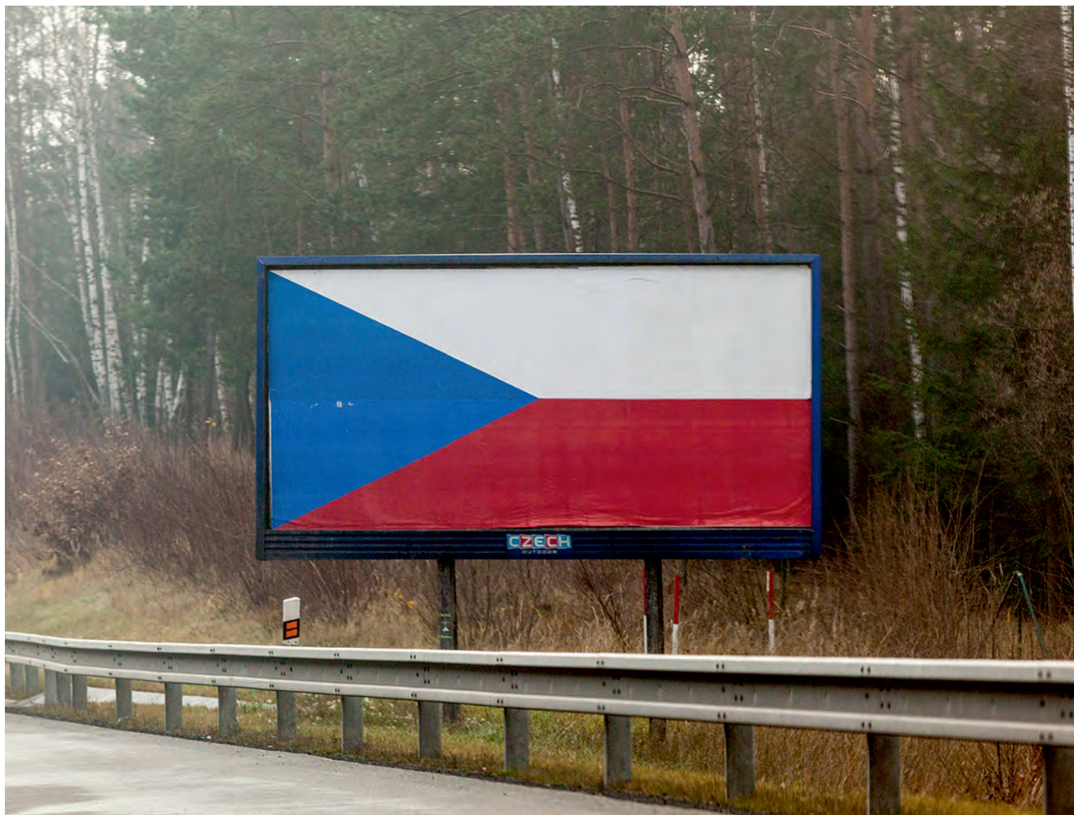
DANIEL HUŠTÁK - ZE SOUBORU ZEMĚ ČESKÁ, DOMOV MŮJ