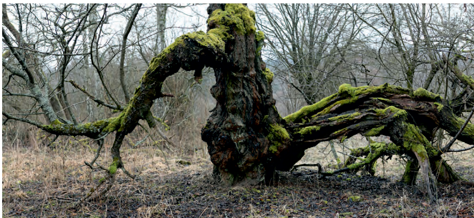
ŠIMON PIKOUS - ZE SOUBORU NOVÉ HORIZONTY