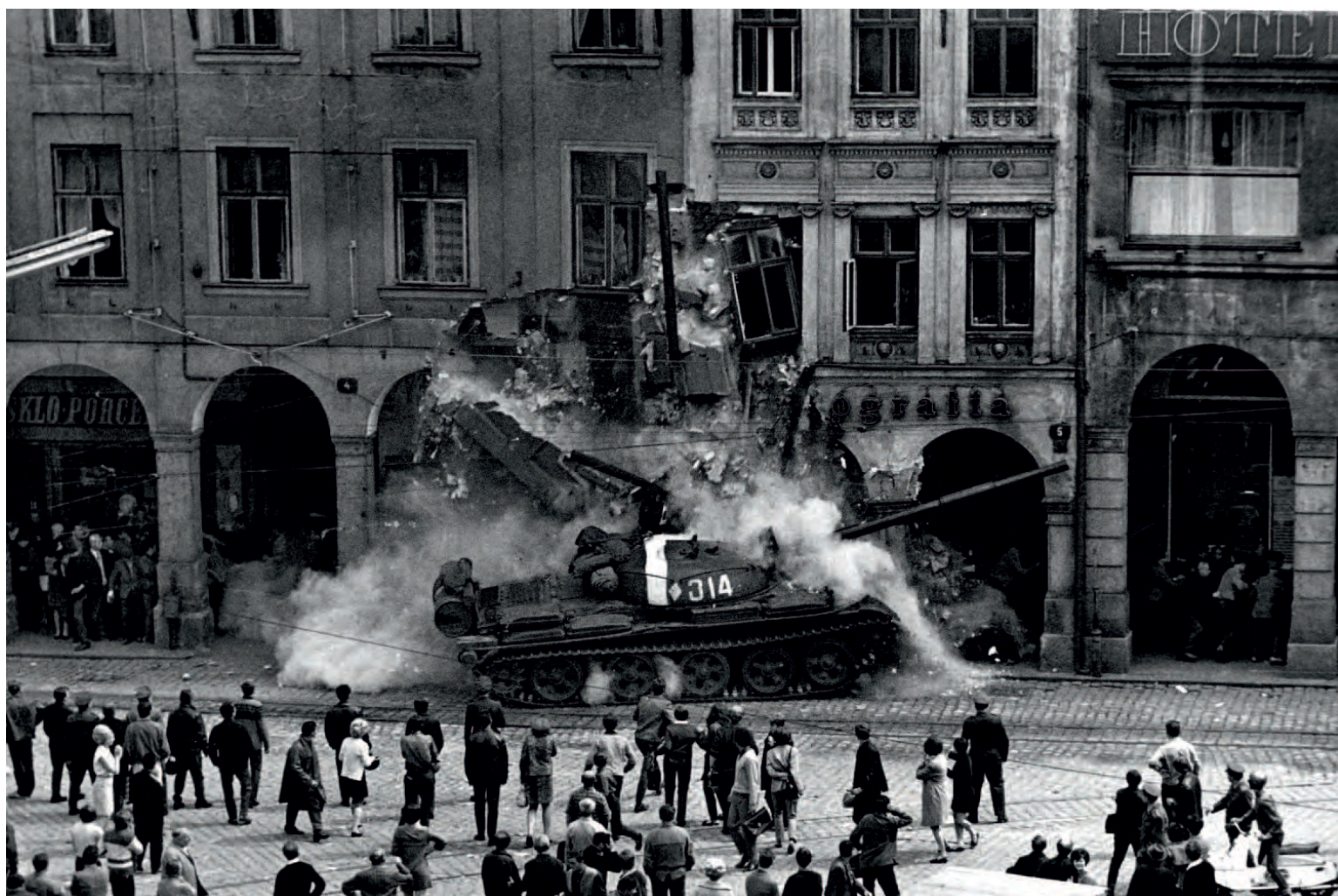
50. VÝROČÍ LIBERECKÉHO SRPNA 1968 VE FOTOGRAFIÍCH, VÁCLAV TOUŽIMSKÝ