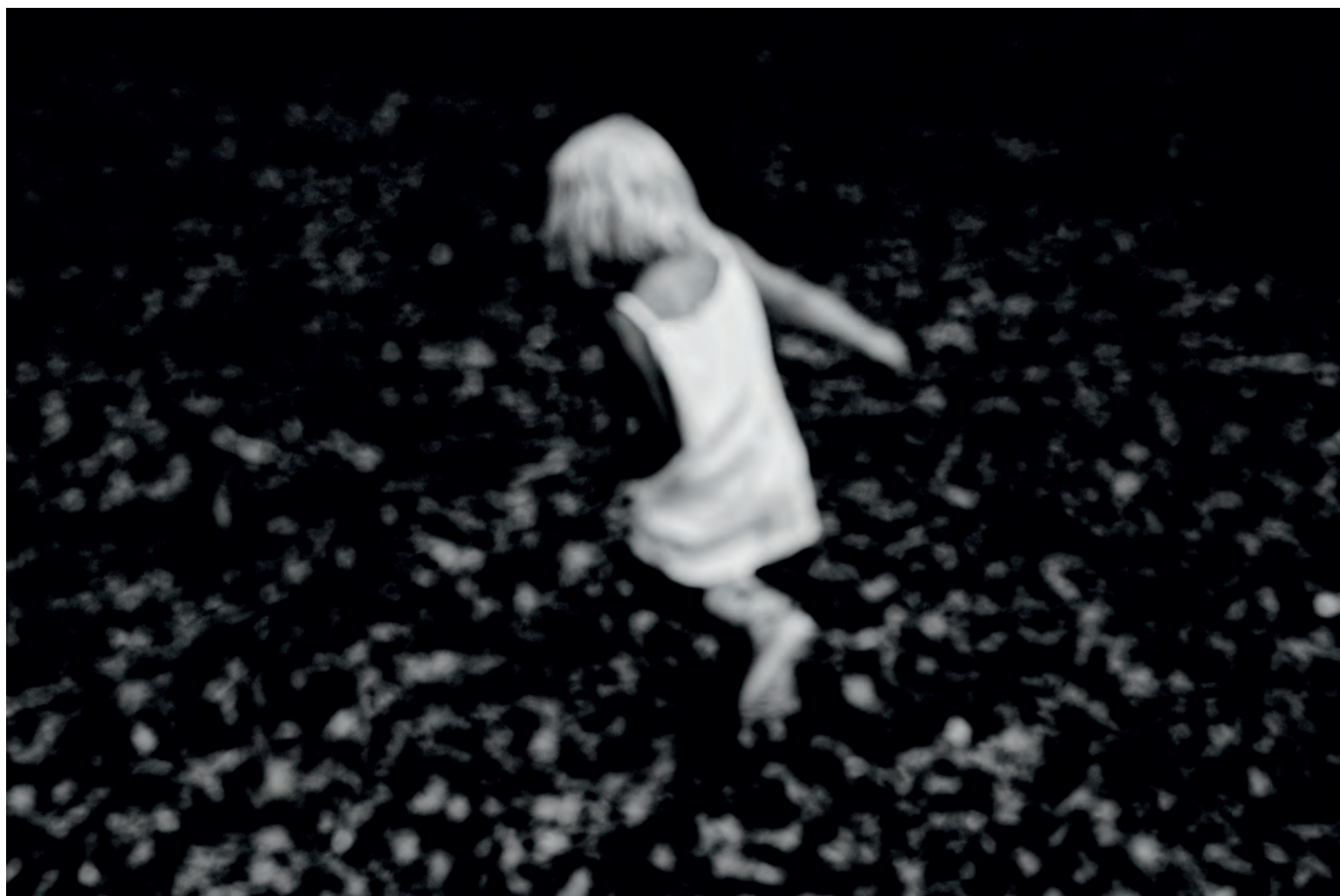
LUCIE ČEJKOVÁ - ZE SOUBORU SEN O SNU