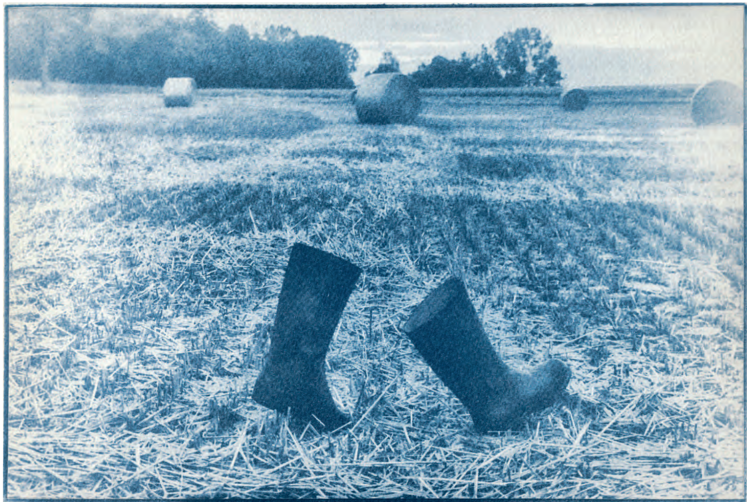
DAGMAR SKOŘEPOVÁ - ZE SOUBORU TAJNÝ VÝLET