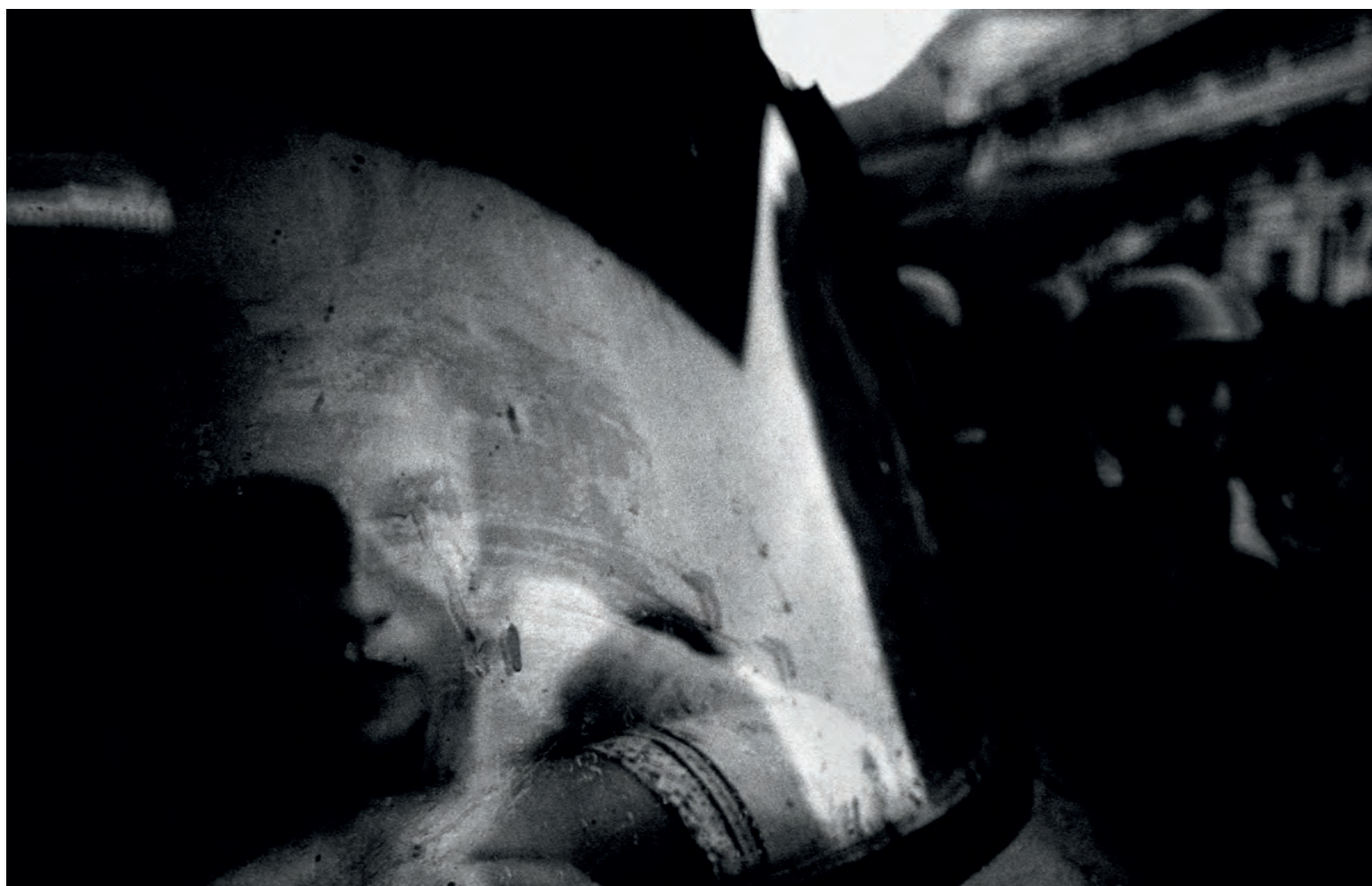
ANTONÍN KRATOCHVÍL - ZE SOUBORU ZAKÁZANÉ PROSTORY