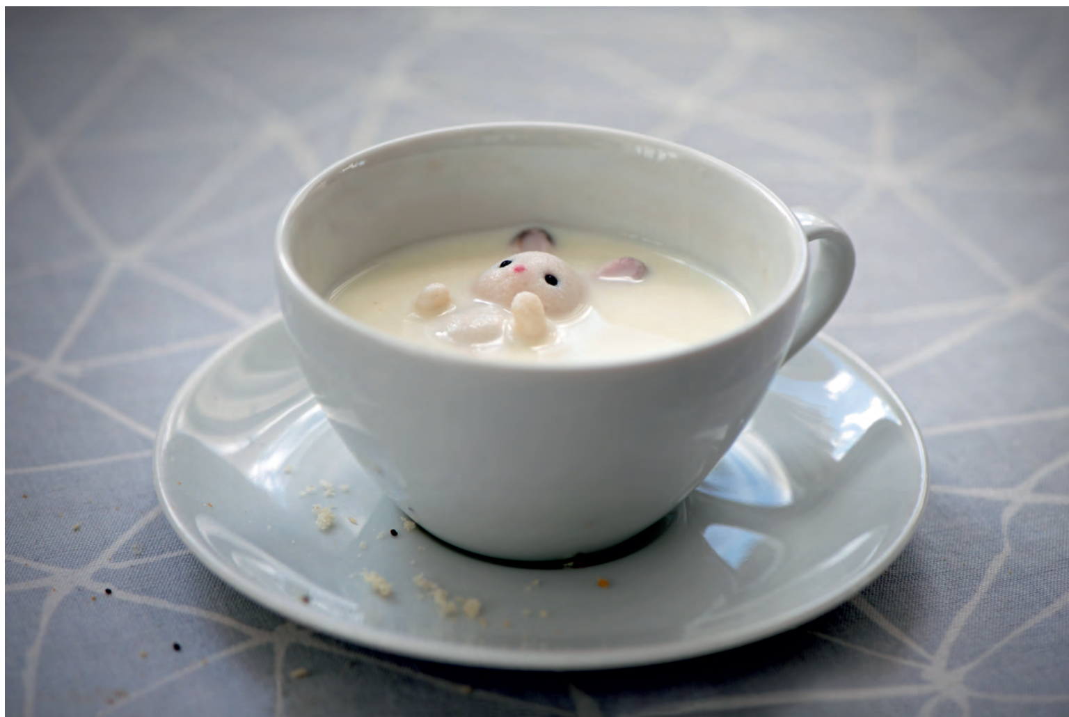
SIMONA KALA - ZE SOUBORU CO ZŮSTÁVÁ