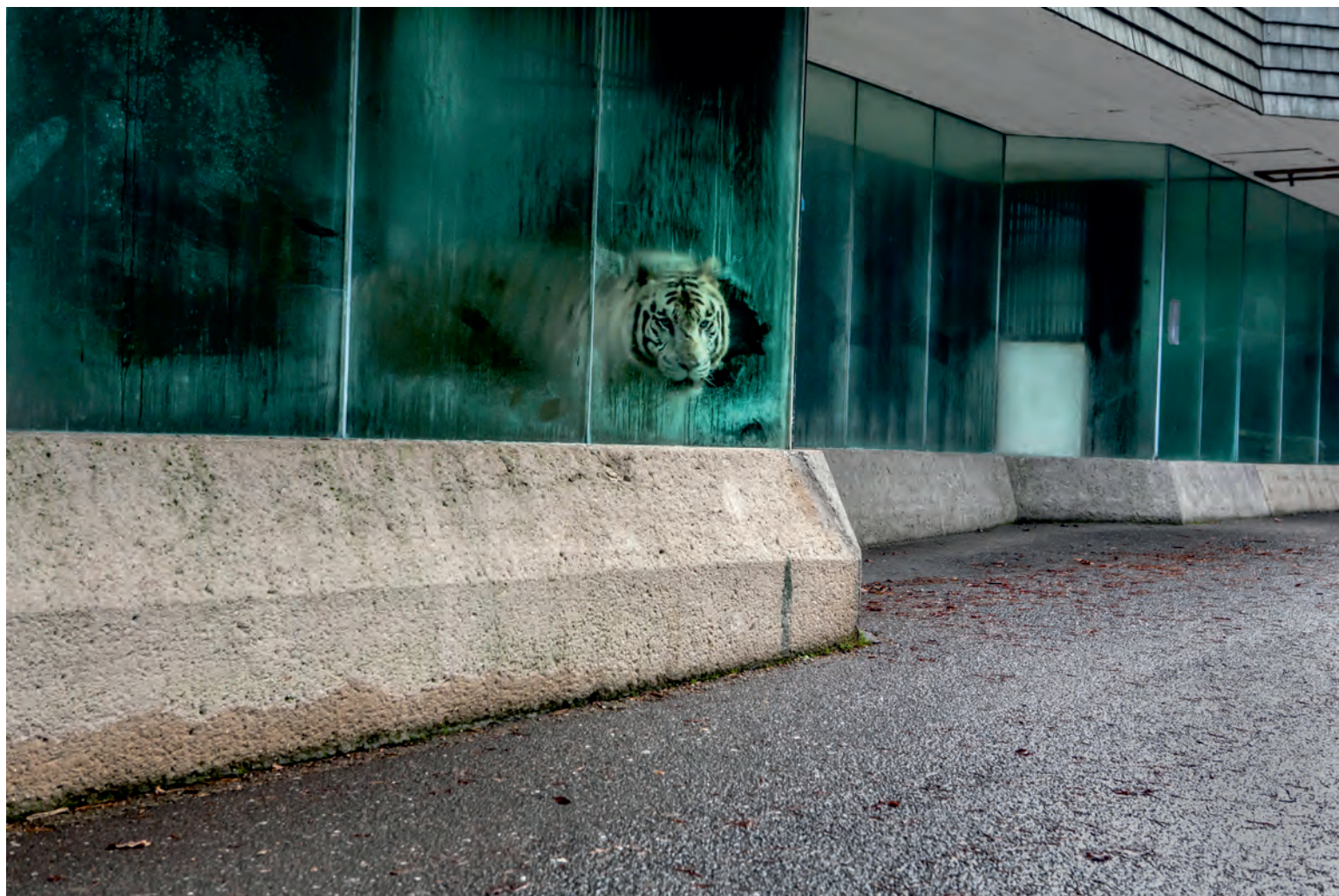
RADEK KALHOUS - ZE SOUBORU DIVOČINA