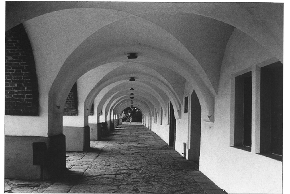
PODLOUBÍ Václav Kmoníček Pardubice