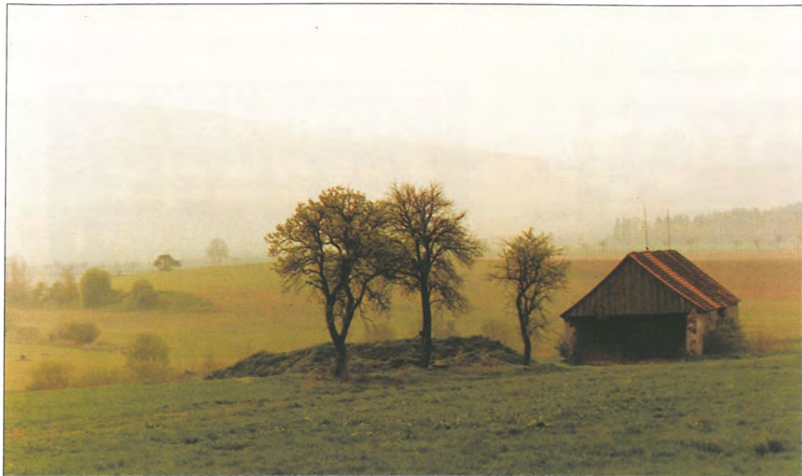
KRAJINA 1 Jiří Plechatý České Budějovice