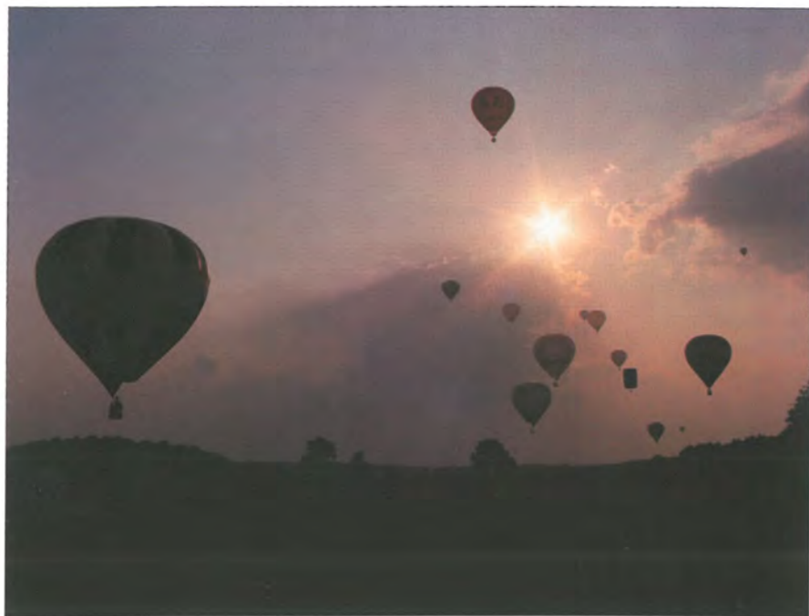
BALÓNY 2 Kamila Rohová Blatná