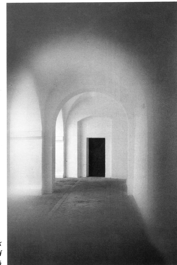
Václav Kozlík Podloubí KAMFO Blatná