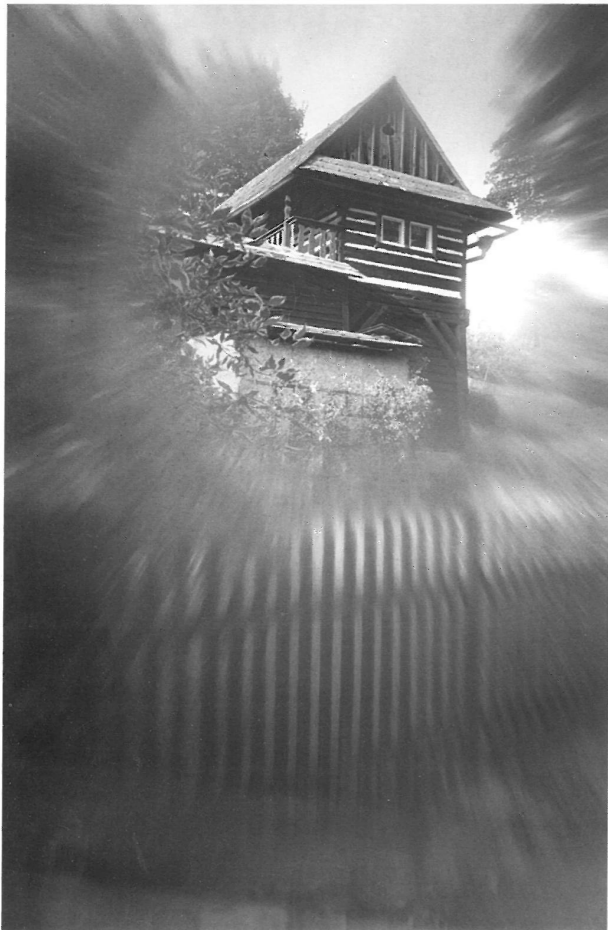
Zdeněk Mauer Chaloupka ARTFOTO Vysoké Mýto