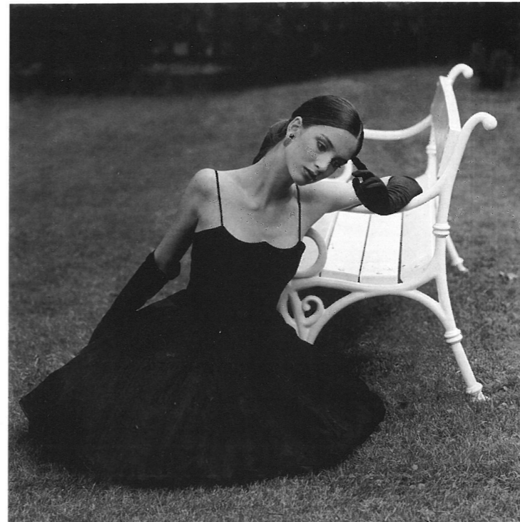
Lukáš Hausenblas Studie I KAMFO Blatná