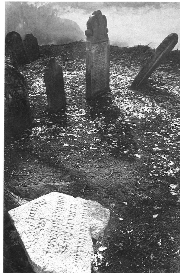
Růžena Švecová Hřbitov FOTOS České Budějovice